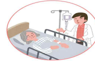
혈압 상승제 투여